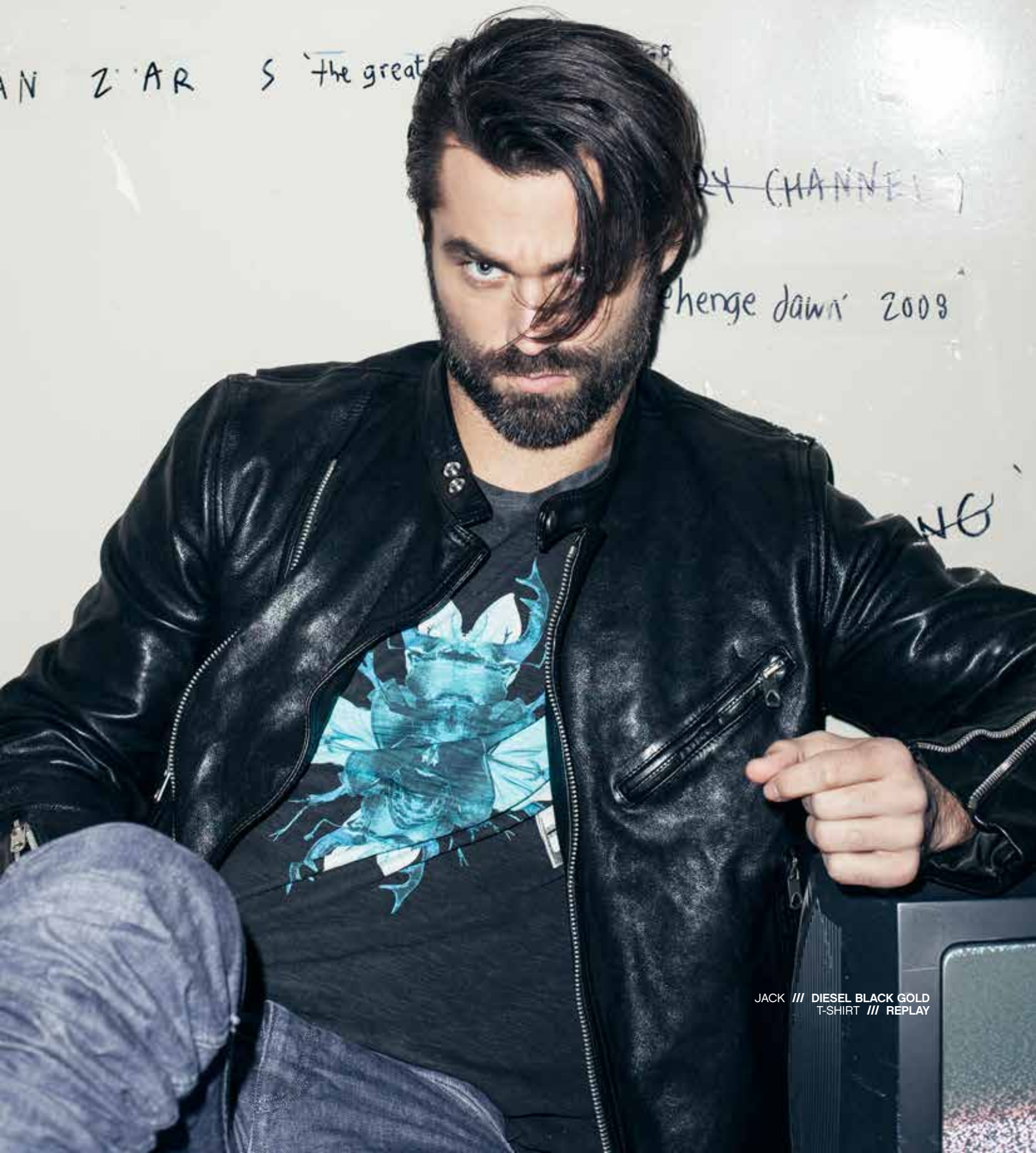
JACK /// DIESEL BLACK GOLD T-SHIRT /// REPLAY