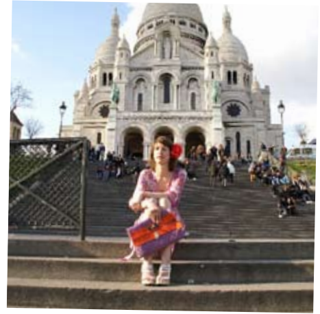
EINDELIJK OP DE PLEK VAN BESTEMMING!