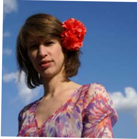
IN DE WOLKEN