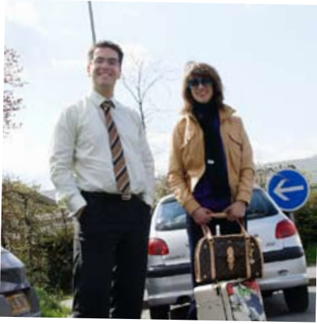
WE ZIJN ER BIJNA! MAAR NOG NIET HELEMAAL...