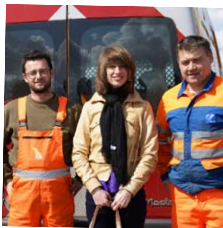
OPGEPIKT IN DE BERM, AFGELEVERD IN DE BEWOONDE WERELD. FLEURS HELDEN DUS.