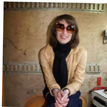
LANVIN, VUITTON EN UW LIFTSTER ACHTER IN EEN WEGWERKERSBUS