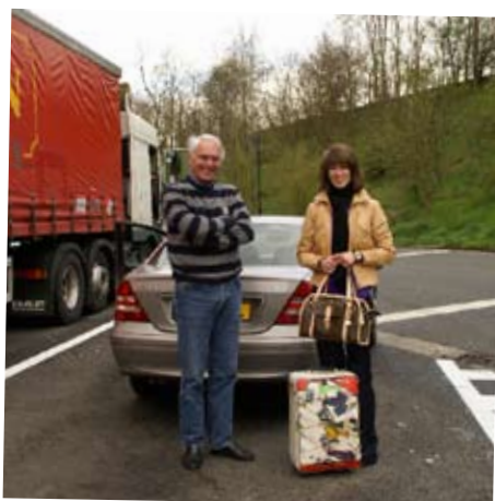
RICHARD GERE KOMT DANKZIJ DE LEUKE LIFTSTER VEEL TE LAAT VOOR DE LUNCH...